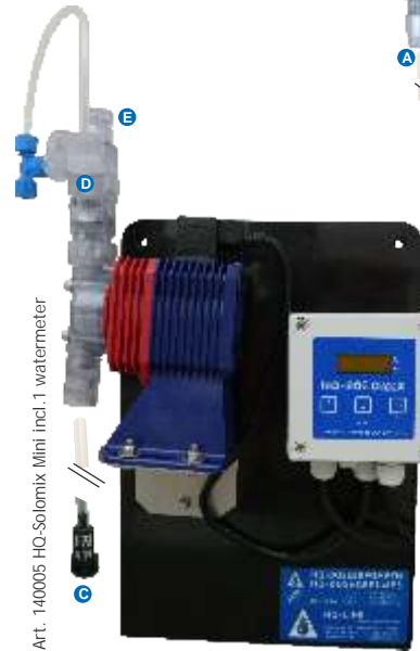
Art. 140005 HQ-Solomix Mini incl. 1 watermeter

De HQ-Solomix MINI heeft een hoge capaciteit, met een toestel kunt u gemakkelijk uw hele bedrijf behandelen, bovendien kan de pomp werken tot maximaal 5 bar, de watermeter kan aangepast worden aan uw waterleidingdiameter, waardoor u op u bedrijf voldoende druk overhoudt.