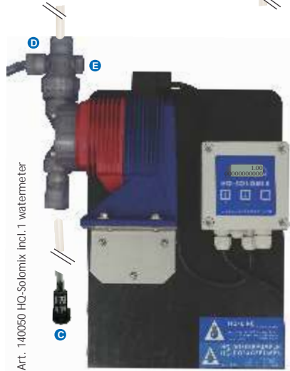
Art. 140050 HQ-Solomix incl. 1 watermeter

De pomp wordt compleet geleverd met watermeter en bijbehorende slangen